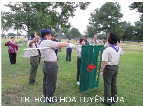
TR. HỒNG HOA TUYÊN HỨA