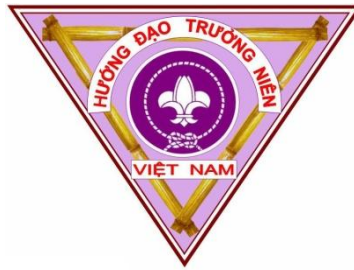
SINH HOẠT TT10