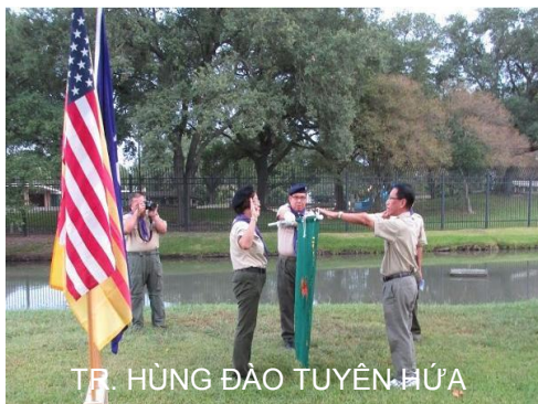
TR. HÙNG ĐÀO TUYÊN HỨA