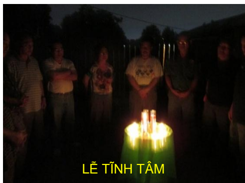
LỄ TĨNH TÂM