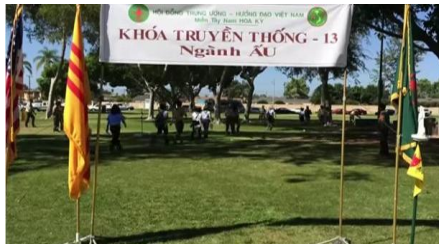
KHÓA HUẤN LUYỆN TRUYỀN THỐNG HQ VÀ VĂN HÓA VN LẦN THỨ 13 ĐƯỢC TỔ CHỨC TẠI MIỀN TÂY NAM HOA KỲ VÀO NGÀY 13 VÀ 14 THÁNG 9 NĂM 2014