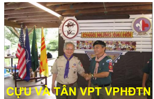
CỰU VÀ TÂN VPT VPHĐTN