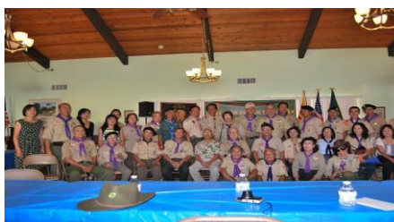
LỄ KỶ NIỆM 10 NĂM THÀNH LẬP LÀNG BÁCH HỢP QUẢNG TẾ ĐÃ ĐƯỢC TỔ CHỨC TẠI PHÒNG SINH HOẠT EL LAMO THÀNH PHỐ WESTMINSTER USA NGÀY 5 THÁNG 10 2014

BÁO LIÊN LẠC XIN CẢM TẠ VÀ XIN PHÉP QUÝ TÁC GIẢ VỀ NHỮNG TRANH ẢNH, BÀI VỞ TỪ SÁCH BÁO, INTERNET...MÀ BBT TRÍCH RA ĐỂ ĐĂNG TRONG SỐ BÁO NÀY.