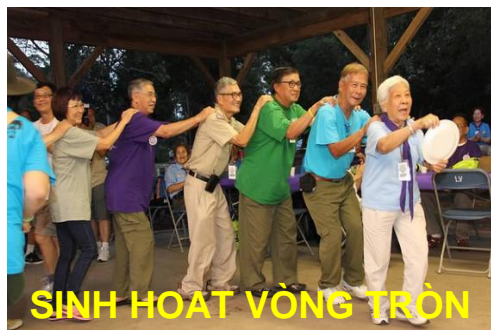
SINH HOẠT VÒNG TRÒN