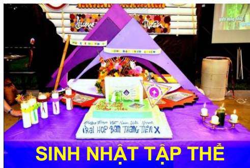
SINH NHẬT TẬP THỂ