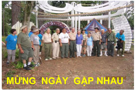
MỪNG NGÀY GẶP NHAU