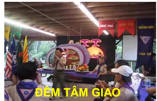
ĐÊM TÂM GIAO