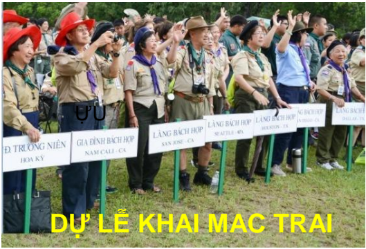
DỰ LỄ KHAI MẠC TRẠI