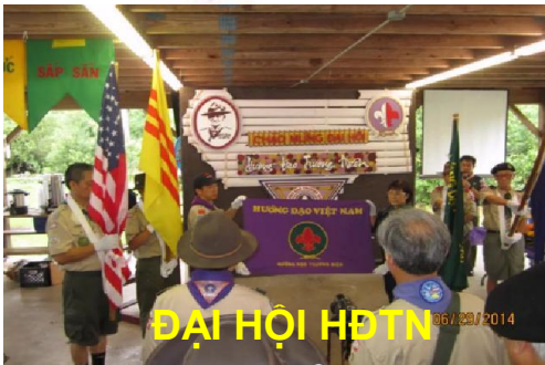
ĐẠI HỘI HĐTN