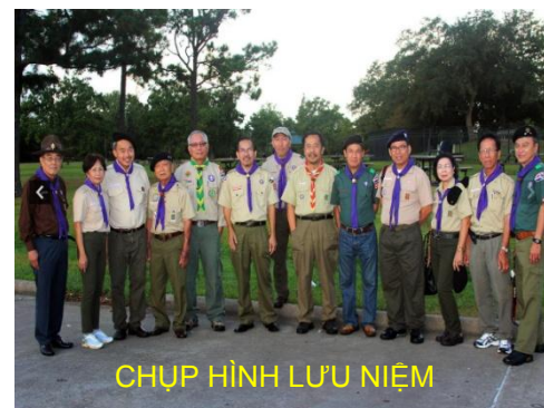
CHỤP HÌNH LƯU NIỆM