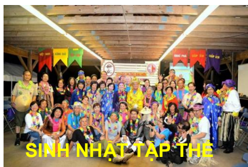
SINH NHẬT TẬP THỂ