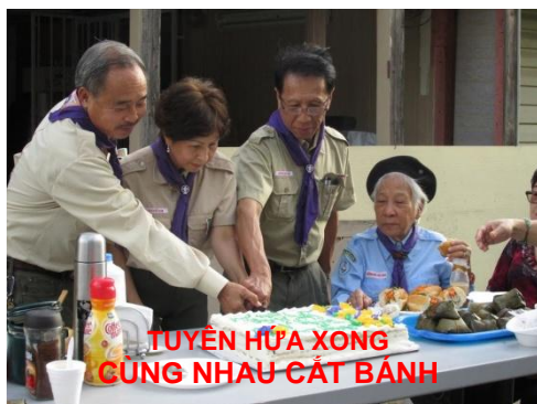
TUYÊN HỨA XONG CÙNG NHAU CẮT BĂNH