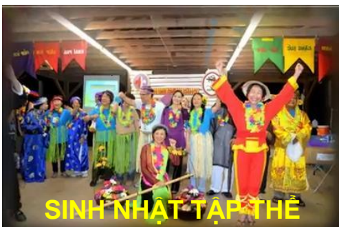
SINH NHẬT TẬP THỂ