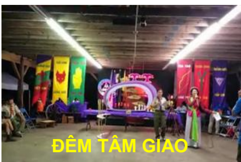
ĐÊM TÂM GIAO