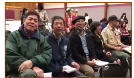
HĐTN Xóm Sacramento tham dự lễ trao Đẳng hiệu Đại Bàng cho 2 Đoàn Sinh LĐ Lạc Việt California