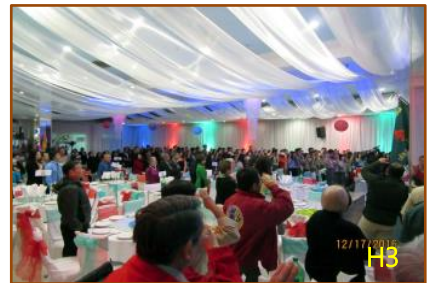
Lễ trao Đẳng thứ Eagle Scout (H1), Silver Award (H2) và tiệc Giáng Sinh LĐ Chí Linh HĐVN (H3)