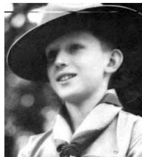
Quốc vương Bỉ trong thời gian ở Thiếu đoàn

Thực, "Élan Loyal", trong thời gian sinh hoạt với Thiếu đoàn.