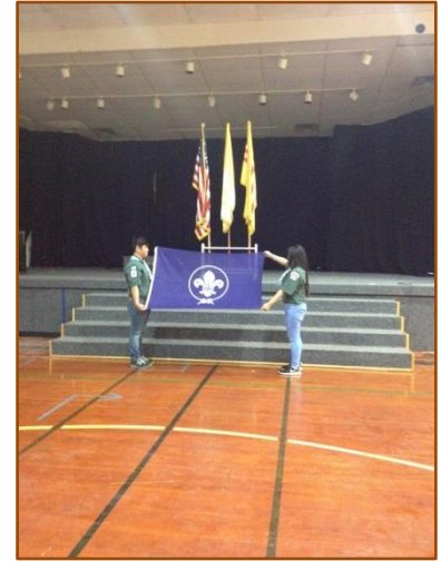
Thanh Đoàn Thánh Phêrô 2811 Dallas, TX chào cờ đầu năm