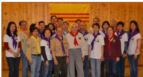
LBH Hoa Lu + LBH Hùng Vương và Ban Huynh Trưởng CN