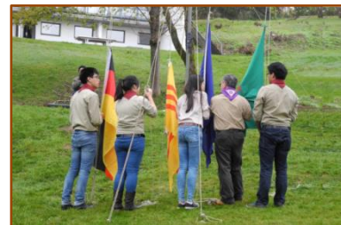
Trại Bách Hợp lần thứ 20 của CN được tổ chức từ ngày 18-21/04/2014 tại Freizeithem Ren You - Hubertus Str 1b - 38700 Braunlage Hohegeiß, tiểu bang Niedersachsen

(Mời Xem: http://www.hdvietnam.de/web/data/File/2014/BH20.pdf )