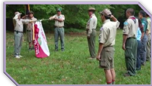
Miền Nam California – 22 Feb. 2017. Nhân kỷ niệm sinh nhật của Lord Baden Powell, người sáng lập Phong Trào Hướng Đạo Thế Giới (22 Feb. 1857 – 8 Jan. 1941)